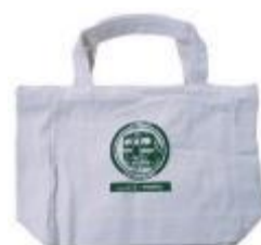
特製トートバック