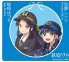
マウスパッド (ブルー) 全3種