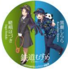
デカ缶バッジ2種 (ツートン) 全2種