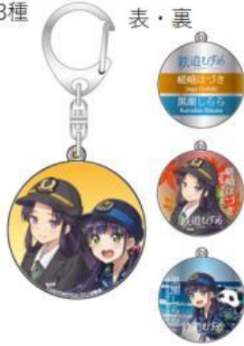
チャームキーホルダー 全3種 表・裏